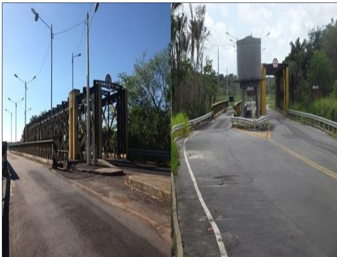
Figura 4- Ponte sobre o rio Livramento e caixa d'água, símbolos do período da colonização agrícola.