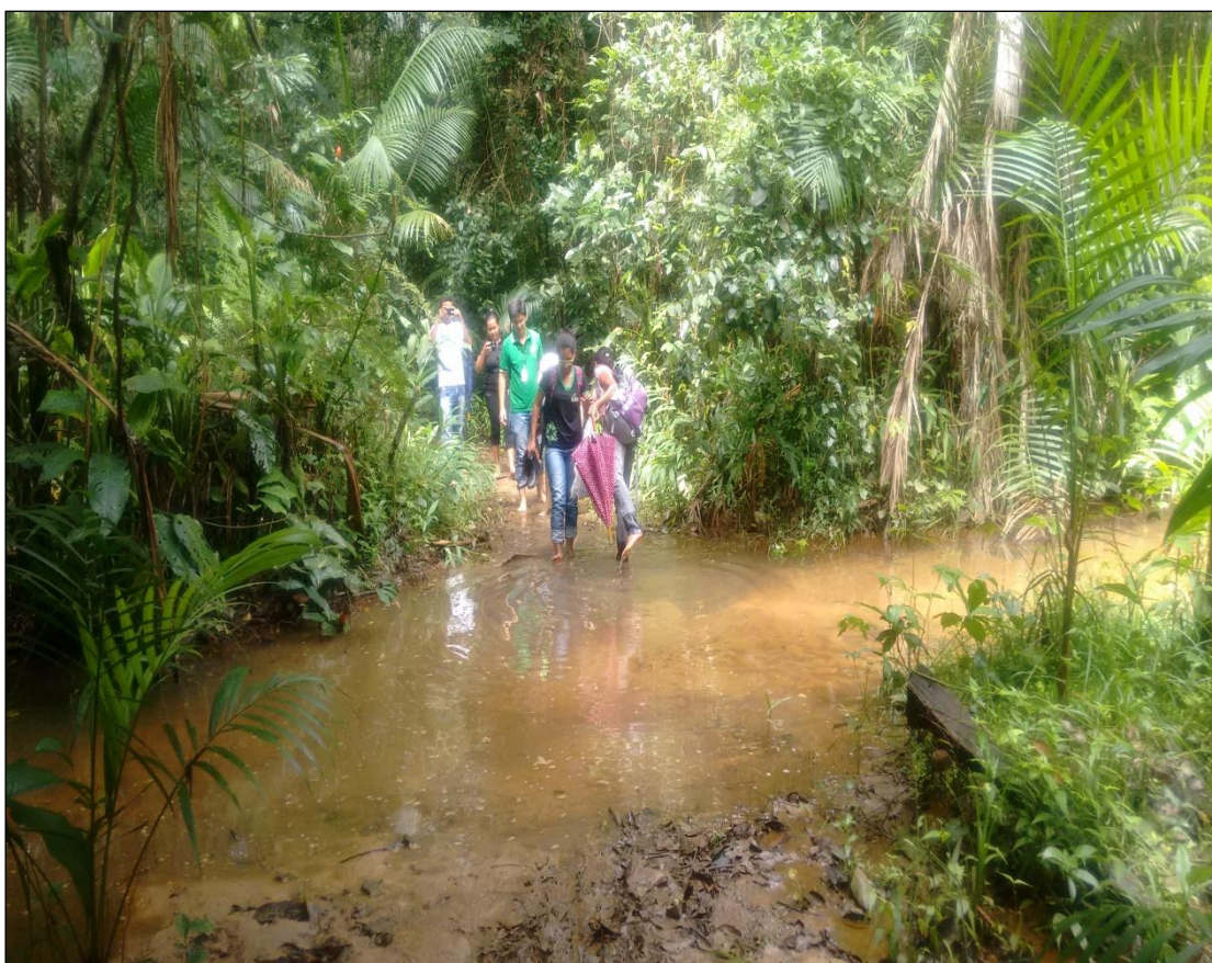
Figura 8: Rio Banheiro

Outro local, antes muito utilizado pelos quilombolas, é o rio chamado Banheiro, que recebeu este nome porque os moradores tomavam banho, lavavam roupas e bebiam água (Figura 8). Com o passar do tempo, após a compra das terras pelos fazendeiros, este rio, que faz parte da história da comunidade e está na lembrança dos moradores, acabou secando. Atualmente, há um movimento organizado pelos moradores de recuperação do rio do Banheiro, que aos poucos está sendo desassoreado e vem se recuperando.