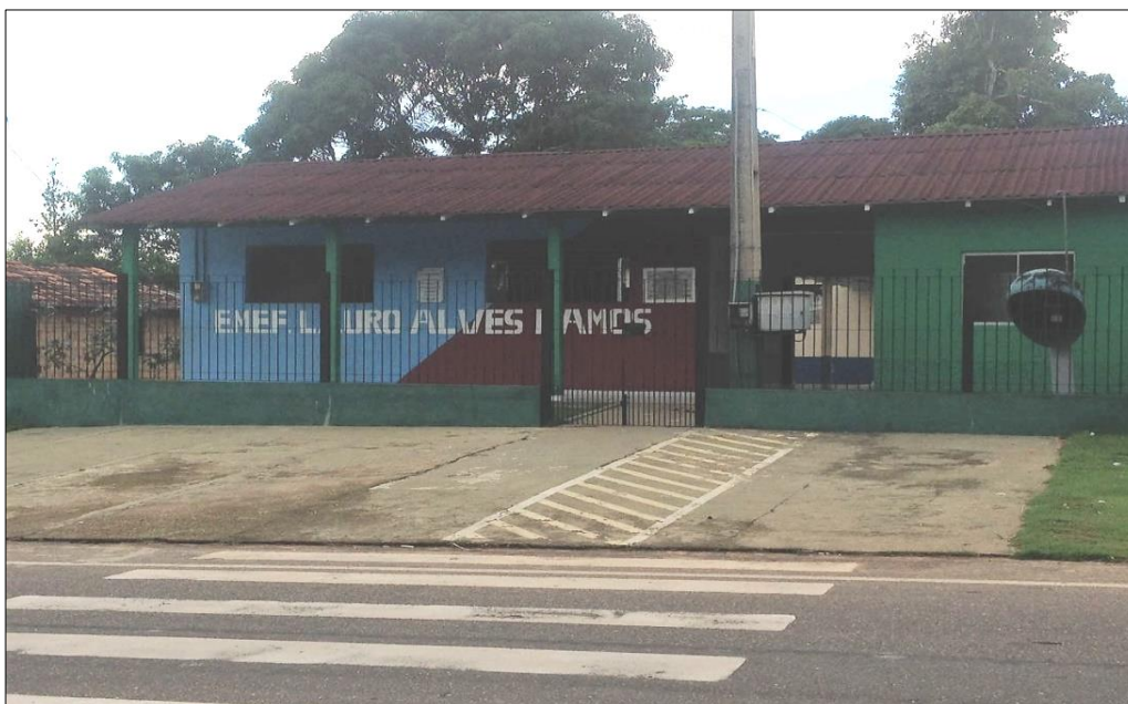
Figura19- Escola da comunidade do Livramento.