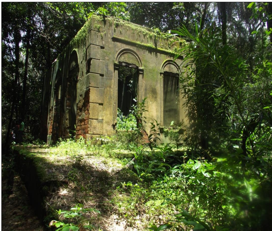
Figura5- Ruínas da estação antiga estrada de Ferro em Livramento