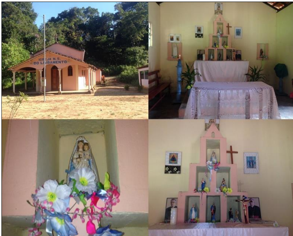
Figura 17- Igreja Católica de Nossa Senhora de Livramento