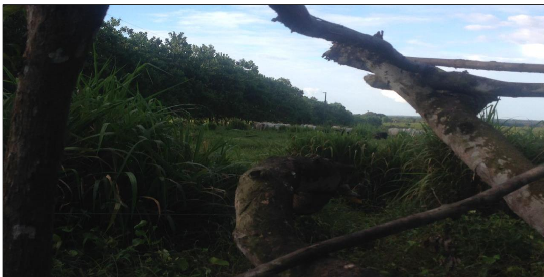
Figura 6- Áreas de pasto com gado, vista dos quintais dos moradores de Livramento