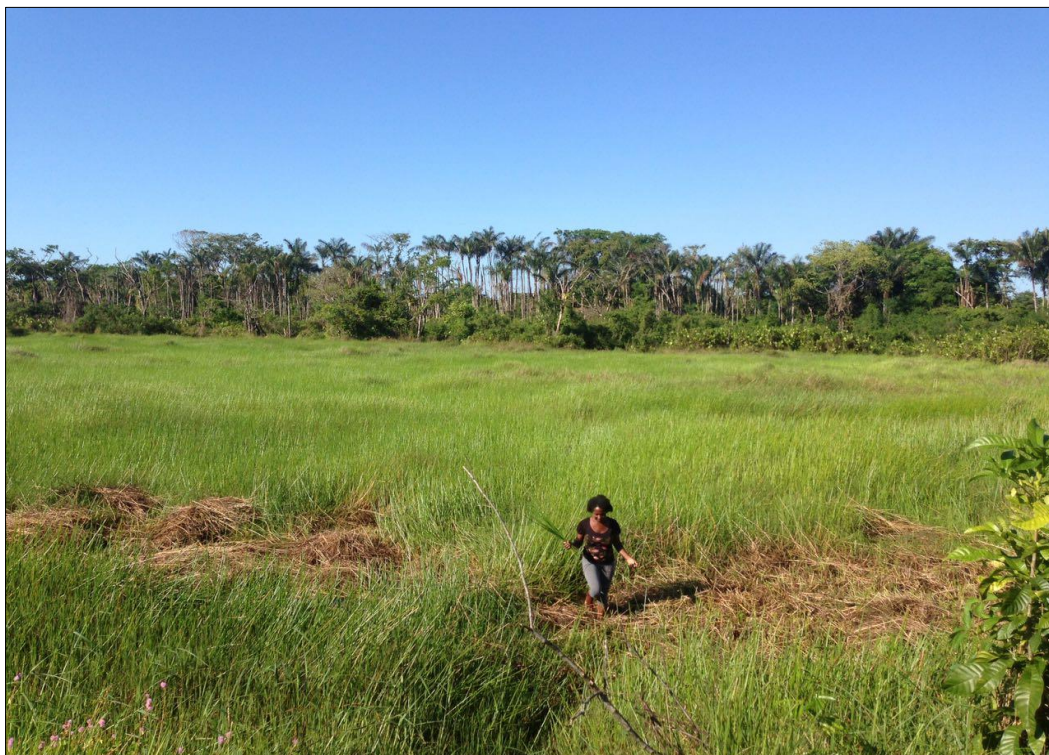
Figura 14- Campos de junco