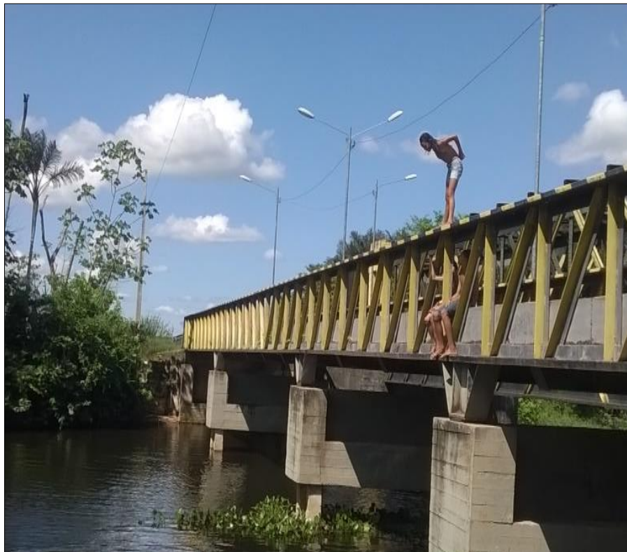
Figura 22- Jovens no dia de lazer na ponte do rio Livramento

local de realização das festas, reclamam do incômodo barulho do som alto durante a noite.