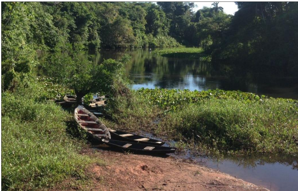
Figura 15 - Canoas utilizadas a para pesca no rio Livramento