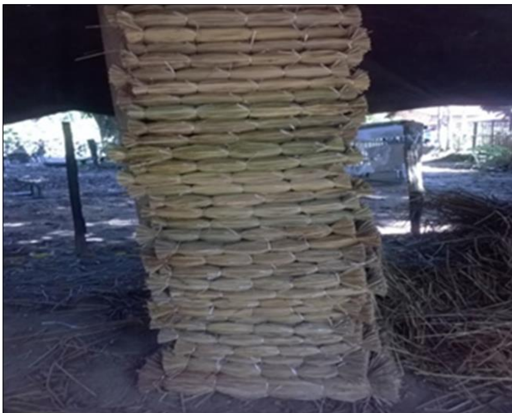
Figura13- Junco seco pronto para venda

não se vê mais muitas árvores de espécies frutíferas. As mais comuns são as mangueiras ( Mangifera indica L.), as jaqueiras ( Artocarpus heterophyllus ) e os ingazeiros ( Inga sessilis ), todas elas ficando mais escassas em função do desmatamento.