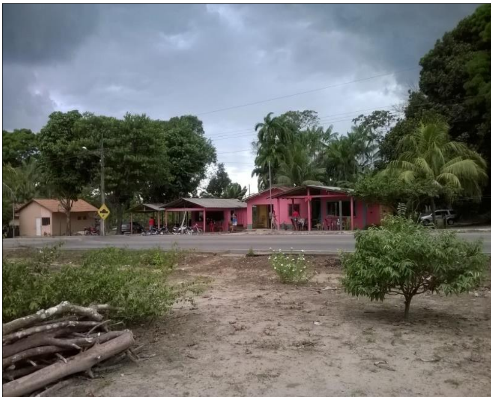
Figura24- Pequenos comércios e bares as margens da PA-242 em Livramento