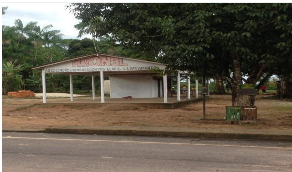
Figura 20: Associação dos moradores ARQNSL Associação de Remanescentes Quilombolas Nossa Senhora do Livramento

Também são discutidas na associação a autorização para a realização de festas na comunidade, um aspecto importante relacionado ao lazer dos moradores. Uma das mais tradicionais é a festa alusiva ao Dia Nacional da Consciência Negra (20 de Novembro) e festividades da Igreja Católica. A associação discute ainda a possibilidade de desenvolvimento de projetos que podem beneficiar a comunidade, entre outros temas de interesse social comunitário. Alguns entrevistados manifestaram insatisfação com a atuação da associação, apontando questões como a desunião entres os moradores da comunidade, o que a enfraquece e impossibilita os moradores de conseguire maiores ganhos sociais para a mesma.