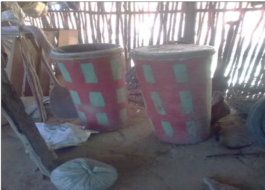
Figura 23- Antigos tambores de carimbo confeccionados por um morador da comunidade

dança, uma herança cultural da comunidade. Assim, os instrumentos artesanais e a dança vão ficando apenas na memória dos antigos moradores.