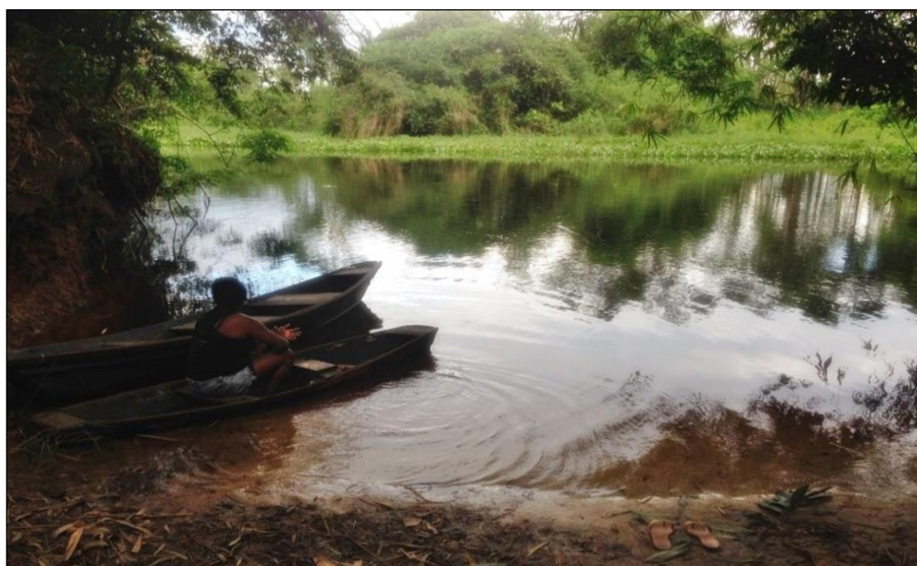
Figura7- Rio Castanhalzinho antigo ponto de comércio fluvial dos moradores

Merece nota ainda a importância do rio Castanhalzinho (Figura 7), que no passado se configurava como um local de comércio fluvial, que ocorria às margens do rio. Nesse local, os moradores da comunidade trocavam ou compravam produtos que por lá passavam. Atualmente, o rio está localizado em terras particulares, pertencentes a um fazendeiro, mas, ainda assim, é possível ver as canoas dos pescadores da comunidade, às margens do rio, pois mesmo com a venda das terras os moradores continuam usando o antigo caminho, no interior da mata, adentrando as terras do fazendeiro, até chegar ao rio.