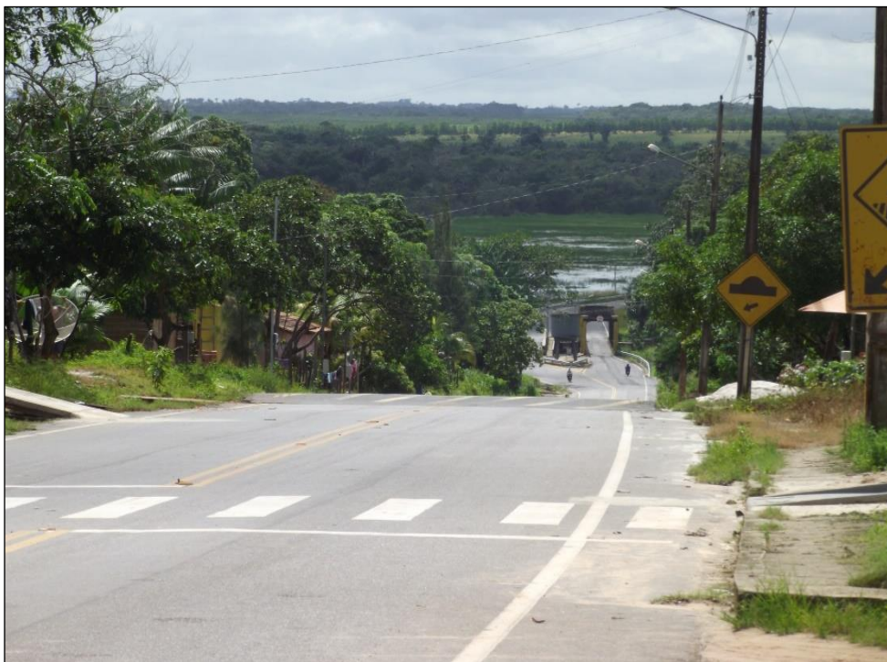
Figura9- Rodovia PA-242, que corta a comunidade do Livramento.

moradores devido a facilidade de acesso ao transporte, muito embora alguns considerem perigoso, temendo a violência e acidentes.