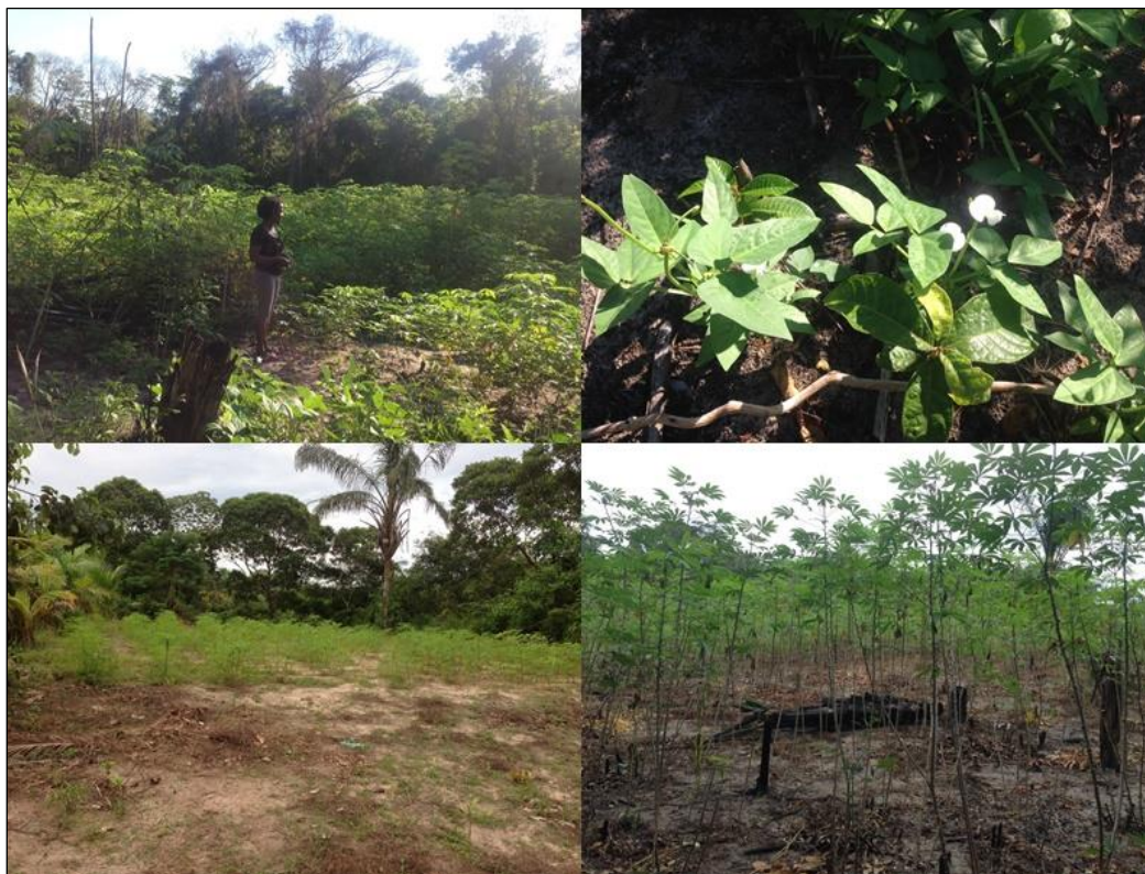
Figura 12- Plantação de e mandioca e feijão no meio da capoeira desmatada.