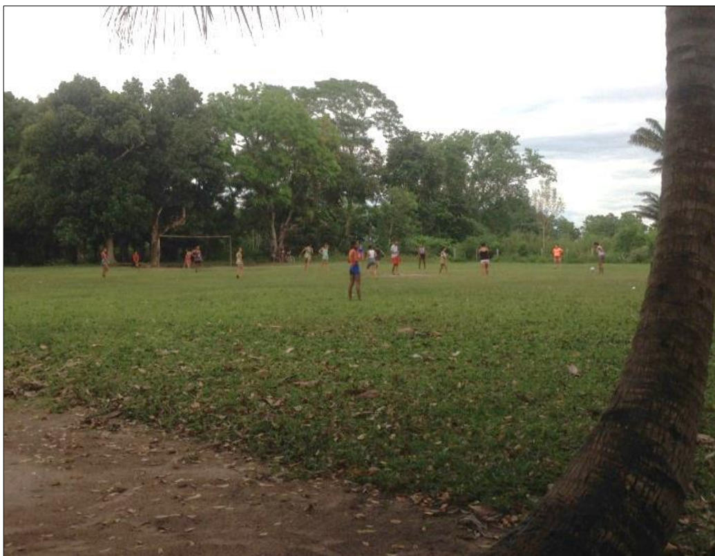
Figura 21- Campo de futebol da comunidade em dia jogo de futebol das mulheres.

O subsistema de lazer é representado pelo futebol organizado pelos moradores, no qual todos participam, homens, mulheres e crianças. Esta é uma das maiores atividades de lazer da comunidade. Os moradores relataram que essa atividade de lazer sempre existiu na comunidade. Nos finais de tarde ou nos finais de semana, os comunitários vão para o campo jogar ou olhar o futebol (Figura 21).