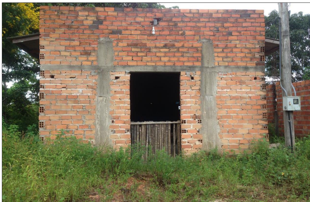
Figura 18 –Igreja evangélica em construção