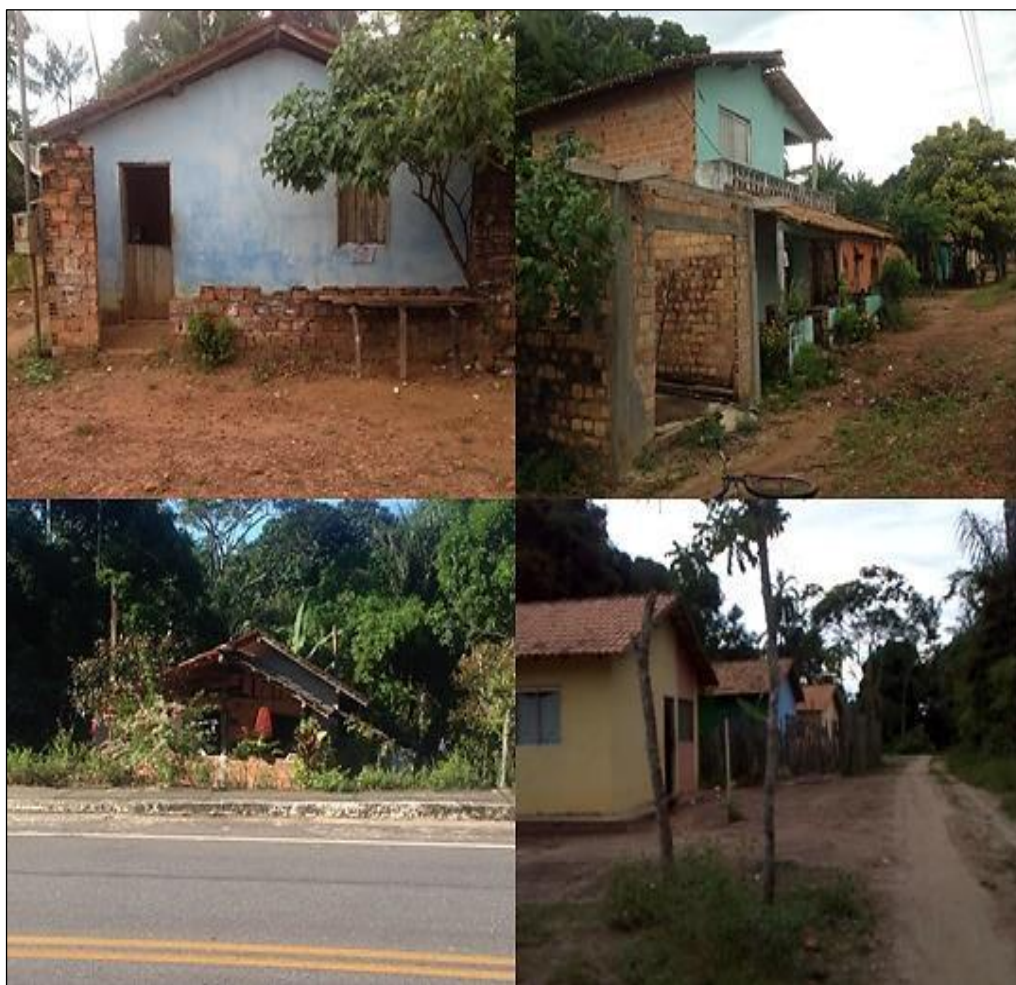
Figura 11- Casas da comunidade