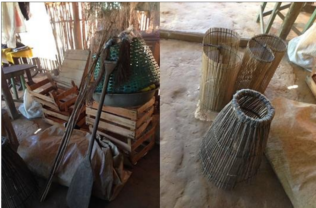
Figura 16 - Equipamentos artesanais utilizados na pesca