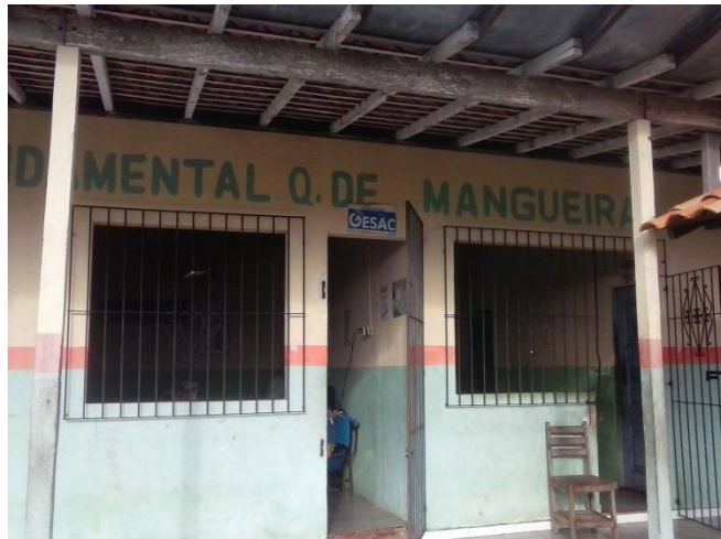
Figura 2-De dentro da Escola Municipal de Ensino Infantil e Fundamental Quilombola de Mangueira