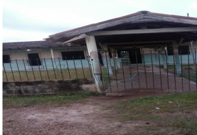
Figura 1- Frente da Escola Municipal de Ensino Infantil e Fundamental Quilombola de Mangueira