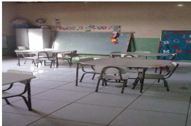
Figura 5- Sala do Jardim III da Educação Infantil