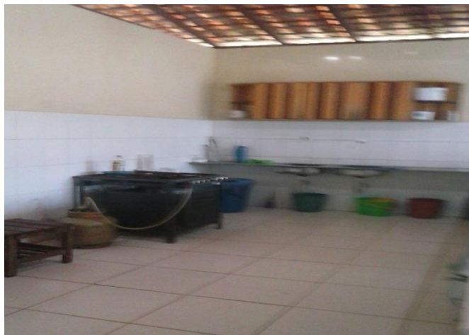
Figura 8- Cozinha