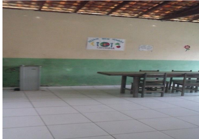
Figura 7- Área do Refeitório