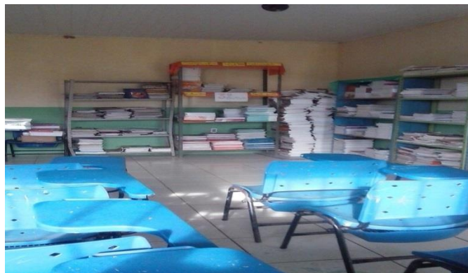
Figura 3- Biblioteca