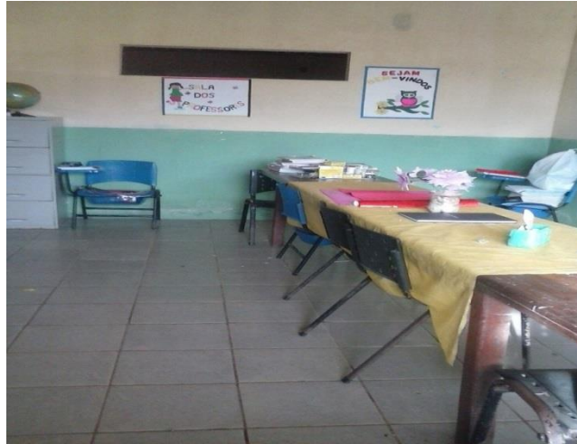
Figura 4- Sala de professores